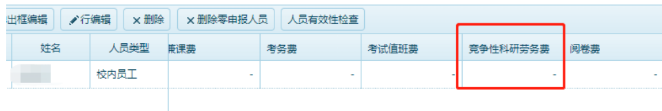
图 3 财务系统竞争性科研劳务费发放

4. 劳务费发放对象为校内人员时，不纳入绩效工资总额，发放内容选择“竞争性科研经费”，如图 3 所示，绩效支出安排应与科研人员在课题实施中的实际贡献挂钩，根据实际的科研进度分段发放。